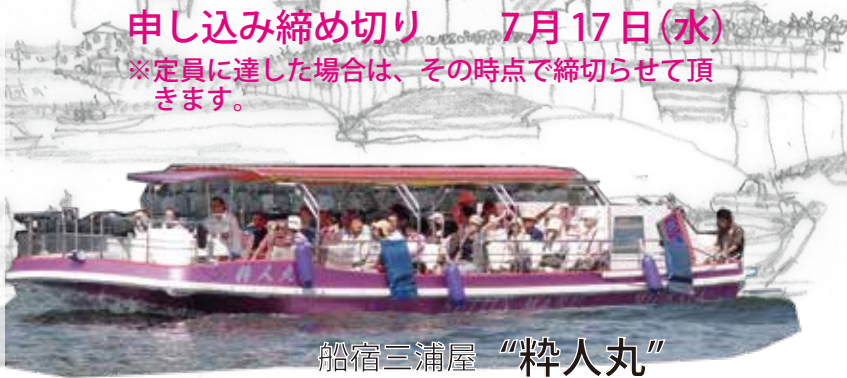
船宿三浦屋 “粹人丸”